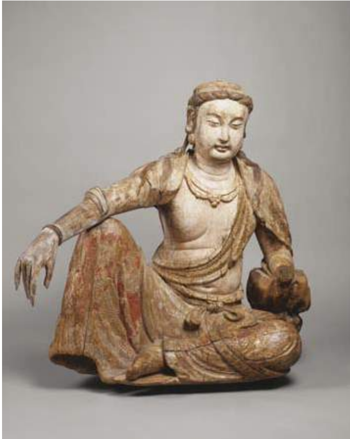
Guanyin en bois polychrome Chine, dynastie des Song, 960 - 1279 Hauteur : 82 cm Collection privée, Taiwan