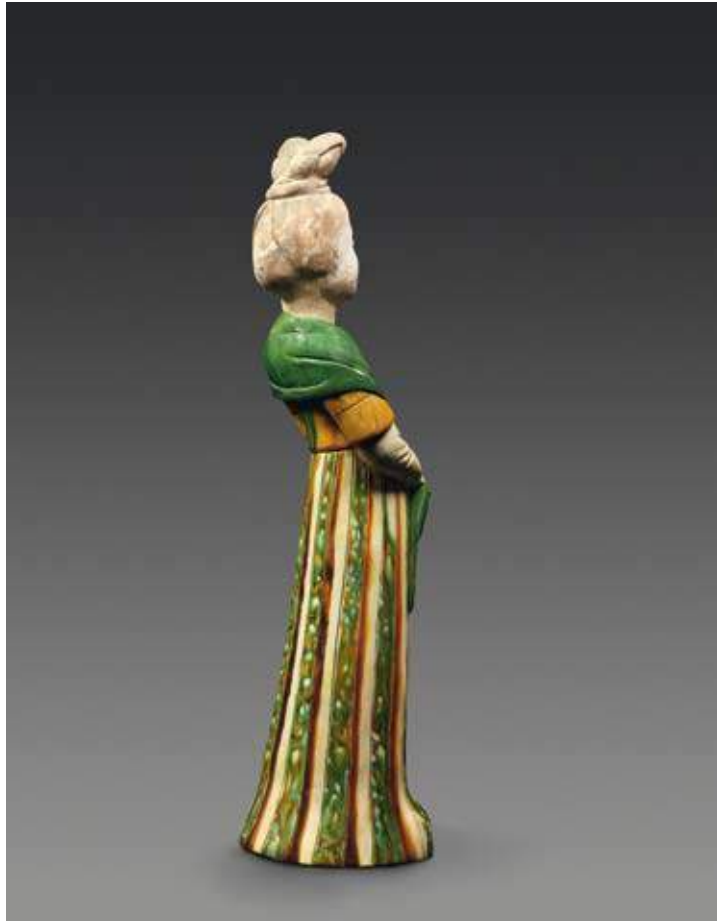
Exceptionnelle Dame de cour debout Terre cuite émaillée sancai « Trois couleurs » Chine, dynastie Tang, 618-907 H : 62 cm